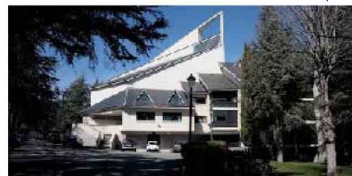
Casa de Ejercicios San José

Datos del mapa ©2017 Google, Inst. Geogr. Nacional 200 m